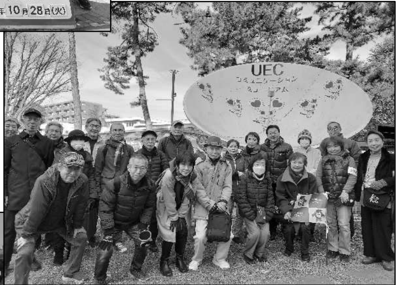
UECコミュニケーションミュージアムガイドツアー(電気通信大学)