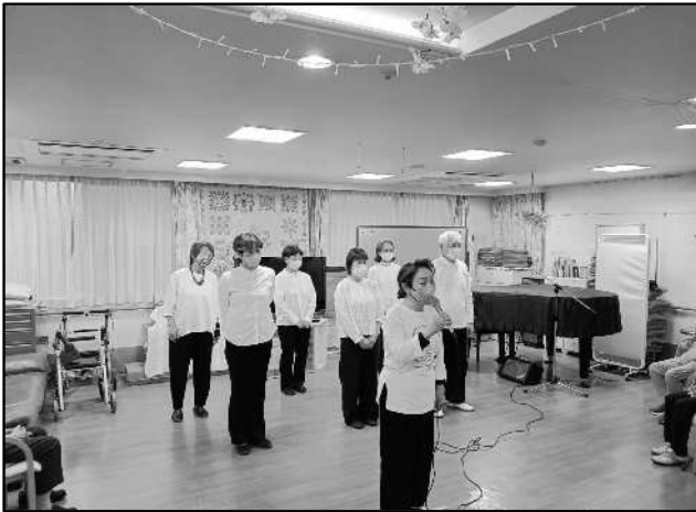
太極拳 ふれあい(太極拳による健康づくり)