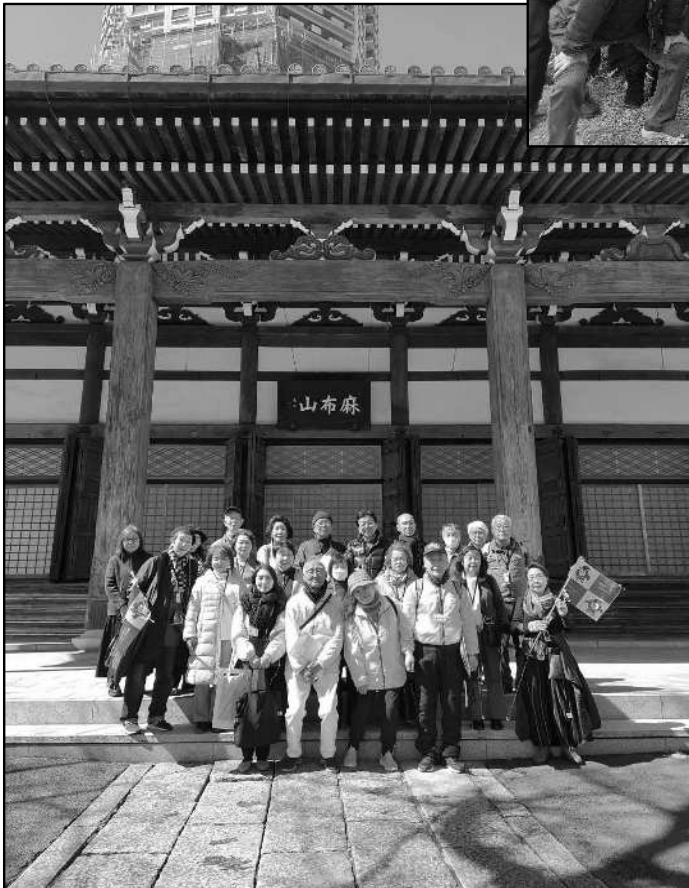
麻布界隈街歩き(ガイド付き)