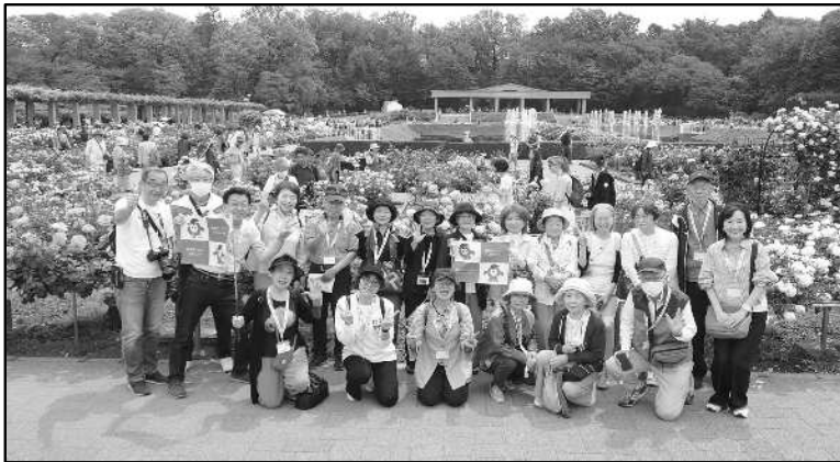
神代植物公園バラガイドとそばランチ