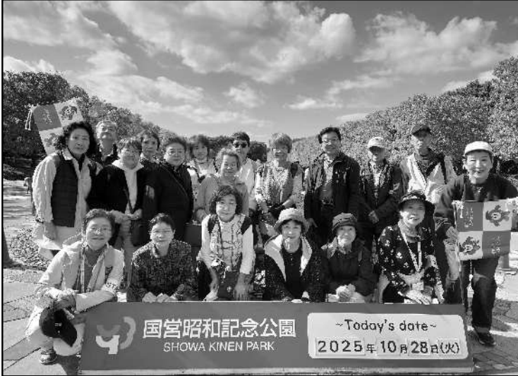
秋の昭和記念公園散策会