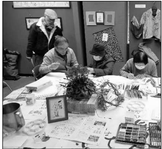
ふくろうの会25(伝書絵を描こう)