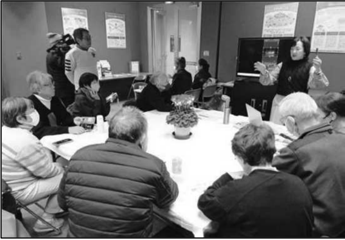
スマホで遊ぼうサークル(動画編集)