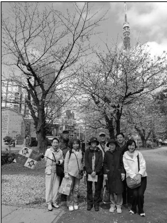
季節の花を愛でる会