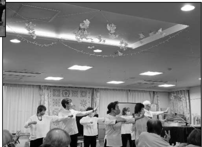
太極拳 ふれあい(太極拳による健康づくり)