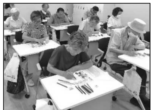
大人の塗り絵教室