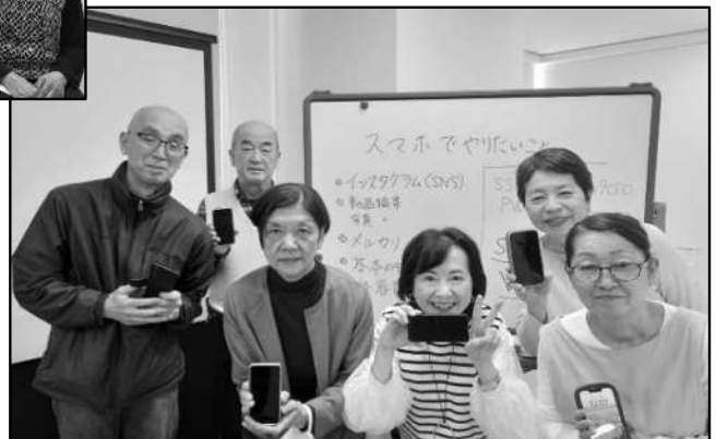
スマホで遊ぼうサークル