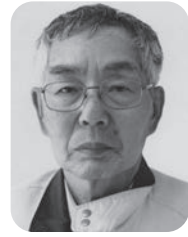
私の趣味は 写真撮影

新年を迎え早くも立春が過ぎ、 関西・東北・北海道では、気温0 度以下、大雪の便りが続いていま すね。